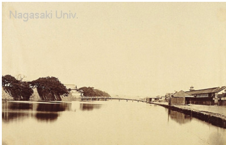
明治初年の馬場先門 長崎大学付属図書館・蔵 橋の左袂が岩倉具視邸か F. ベアト・撮影