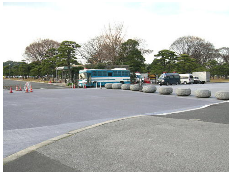
馬場先門跡より岩倉具視邸跡を見る

馬場先門内の角地にある岩倉邸に住んだことから、武四郎は「馬角齋」の号を用いたと言われている。同じ号でも、剛直球の「憂北生」や「北海道人」とは違い、「馬鹿くさい」「兎に角、馬に角」など、北齋張りの捻りを利かせている。